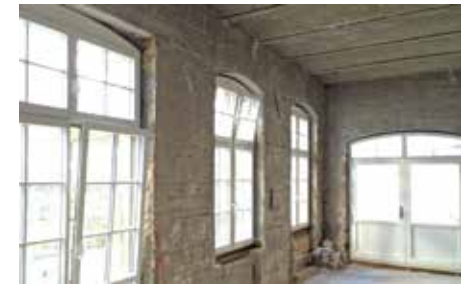
vor der Sanierung

Eine kleine Bauherrngemeinschaft besitzt eine alte Remise mit einer profilierten Ziegelfassade. „Zunächst waren wir skeptisch,“ beschreiben sie ihren Entschluss, die Außenwände von innen zu dämmen. „Aber die Heizkosten waren hoch und ein Wärmedämm-Verbundsystem kam wegen der historischen Fassade nicht in Frage. Die Ziegelansicht sollte unbedingt erhalten bleiben.“