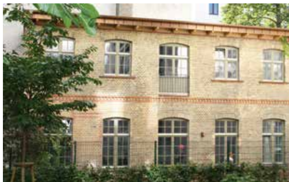
Historische Remise mit Ziegelfassade und Innendämmung

Unser Ziel ist die Definition von Qualitätsmerkmalen auf der Basis anerkannter Standards und der Abbau unbegründeter Ängste vor Innendämmungen. Dies wollen wir durch ein Schulungs- und Zertifizierungssystem, durch aktive Mitarbeit an Regelwerken sowie durch Weiterbildungsmaßnahmen erreichen. Wissenstransfers für Planer, Handwerker und Bauherren sollen bei der Planung und Ausführung von Innendämmungen technologieneutral höchste Qualitätsstandards dauerhaft und zuverlässig gewährleisten.