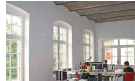
nach der Sanierung

Die Entscheidung haben sie nicht bereut und freuen sich: „Die Wohnung wird spürbar schneller und mit geringerem Energieeinsatz warm. Die damit verbundene Raumtemperatursenkung um etwa 2°C kann bis zu 12 % der Heizkosten einsparen.“ Die Kombination aus Wärmedämmung und Diffusionsoffenheit beugt Schimmelbildung vor und sorgt so für ein gesundes Wohnumfeld.